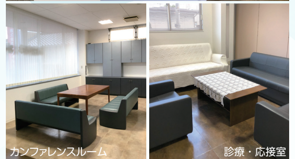
カンファレンスルーム